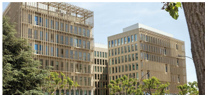
▲ 126-138 avenue de Stalingrad - VILLEJUIF (94)

Il conviendra, pour les associés désirant se porter candidat à un poste de Membre du Conseil de Surveillance et remplissant les conditions ci-dessus énoncées, de faire parvenir à la Société de Gestion avant le 31 mars 2023, un courrier de motivation indiquant leur nom, prénom, âge, le nombre de parts qu'ils possèdent, leurs références professionnelles, la liste de leurs activités au cours des 5 dernières années et de tous les mandats sociaux qu'ils exercent. Des formulaires pour postuler sont disponibles sur notre site Internet.